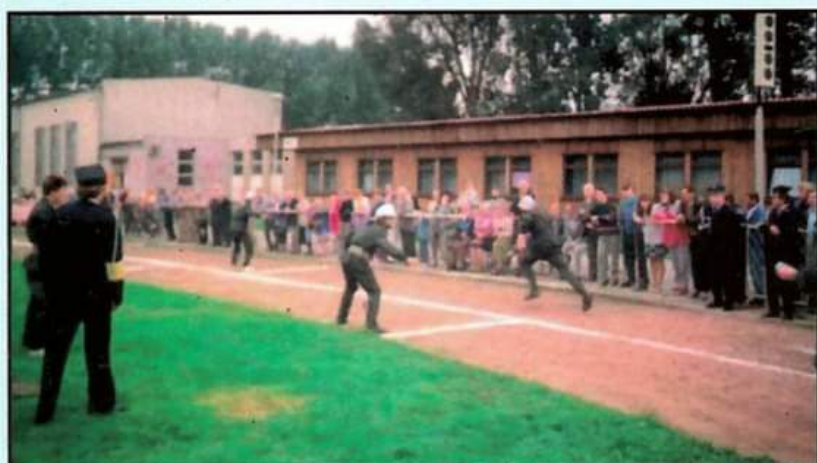
Rok 2000 - zawody sportowo - pożarnicze w Wieruszowie