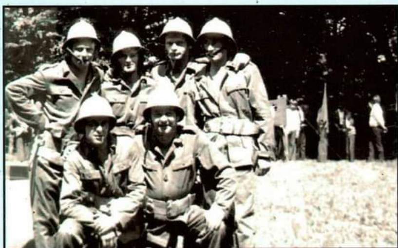
1977 - zawody powiatowe w Sokolnikach