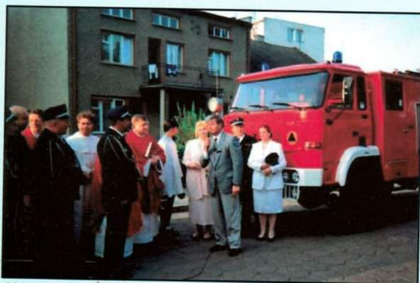
1996r. - poświęcenie nowego samochodu GBA 2,5/16