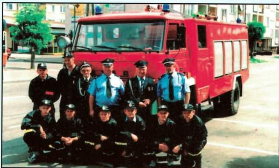
Zarząd oraz członkowie OSP na wspólnym zdjęciu

Jednostka jest wyposażona w urządzenie radiowego systemu selektywnego alarmowania.