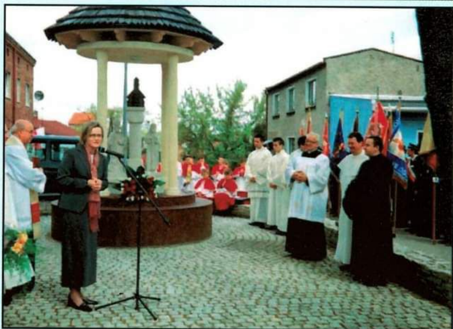
3 maj 2006 - oddanie i poświęcenie kapliczki św. Bartłomieja i św. Mikołaja przy ul. Świerczewskiego