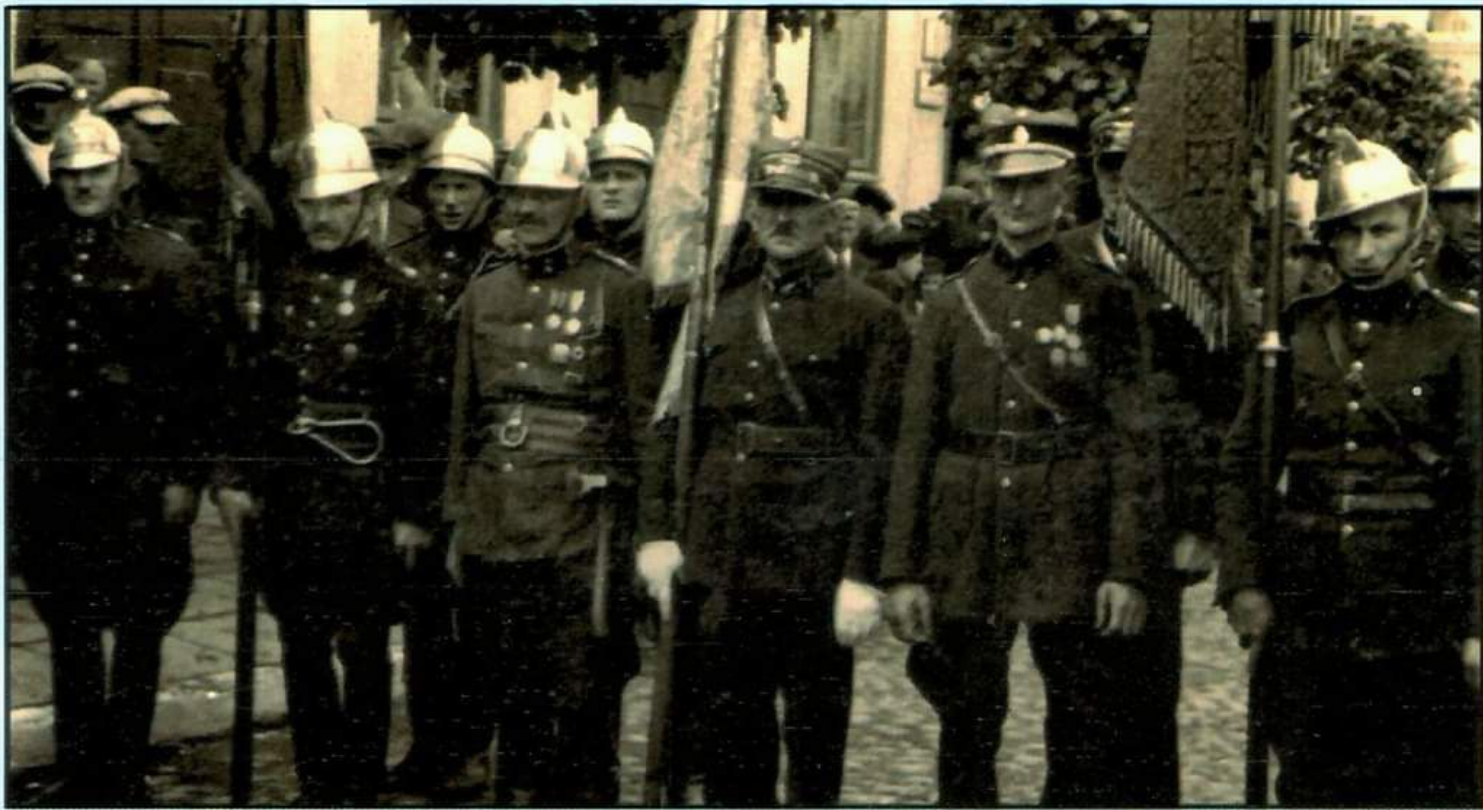
Począty sztandarowe podczas uroczystości z okazji odzyskania niepodległości w okresie międzywojennym