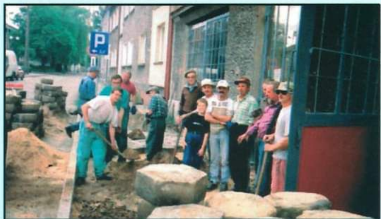
Prace społeczne przed budynkiem OSP

Zasadniczym celem ochotniczych straży pożarnych jest jak najskuteczniejsze interweniowanie tam, gdzie pożar i inne