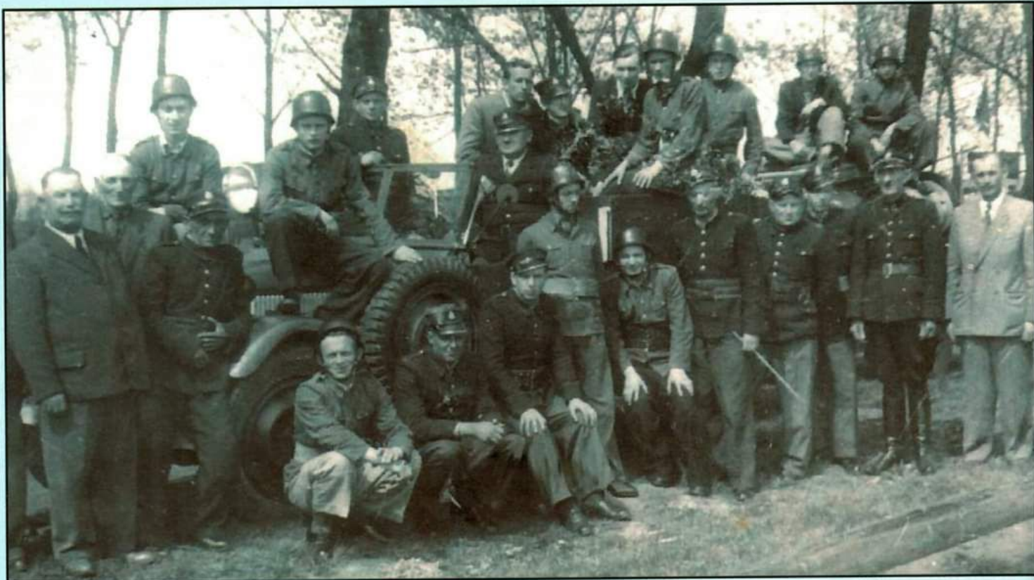
Zbiórka po ćwiczeniach druchów OSP w 1947 roku