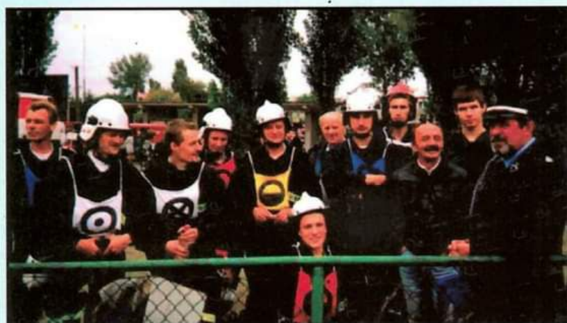
Rok 2000 - zawody sportowo - pożarnicze w Zgierzu