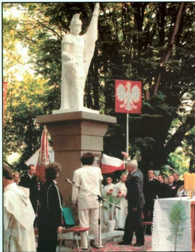
Poświęcenie pomnika św. Floriana w 1990 roku