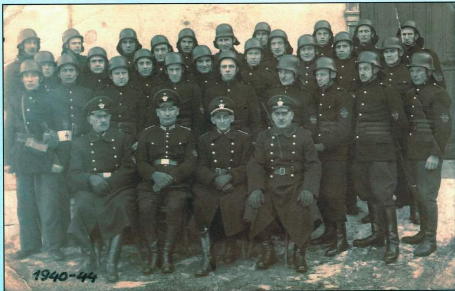
1940-44 Grupowe zdjęcie członków OSP na lata 1940-44