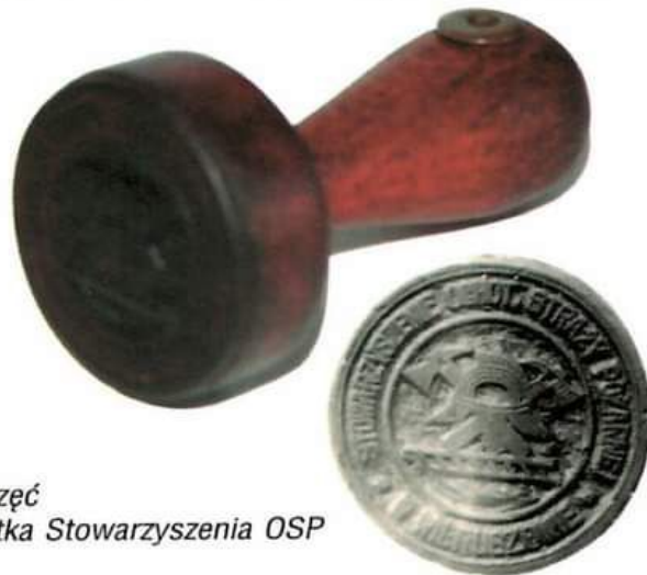
Urzędowa pieczęć - wzór i pieczęć Stowarzyszenia OSP