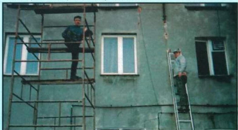
Remont obiektu OSP w 2003r. - położenie elewacji