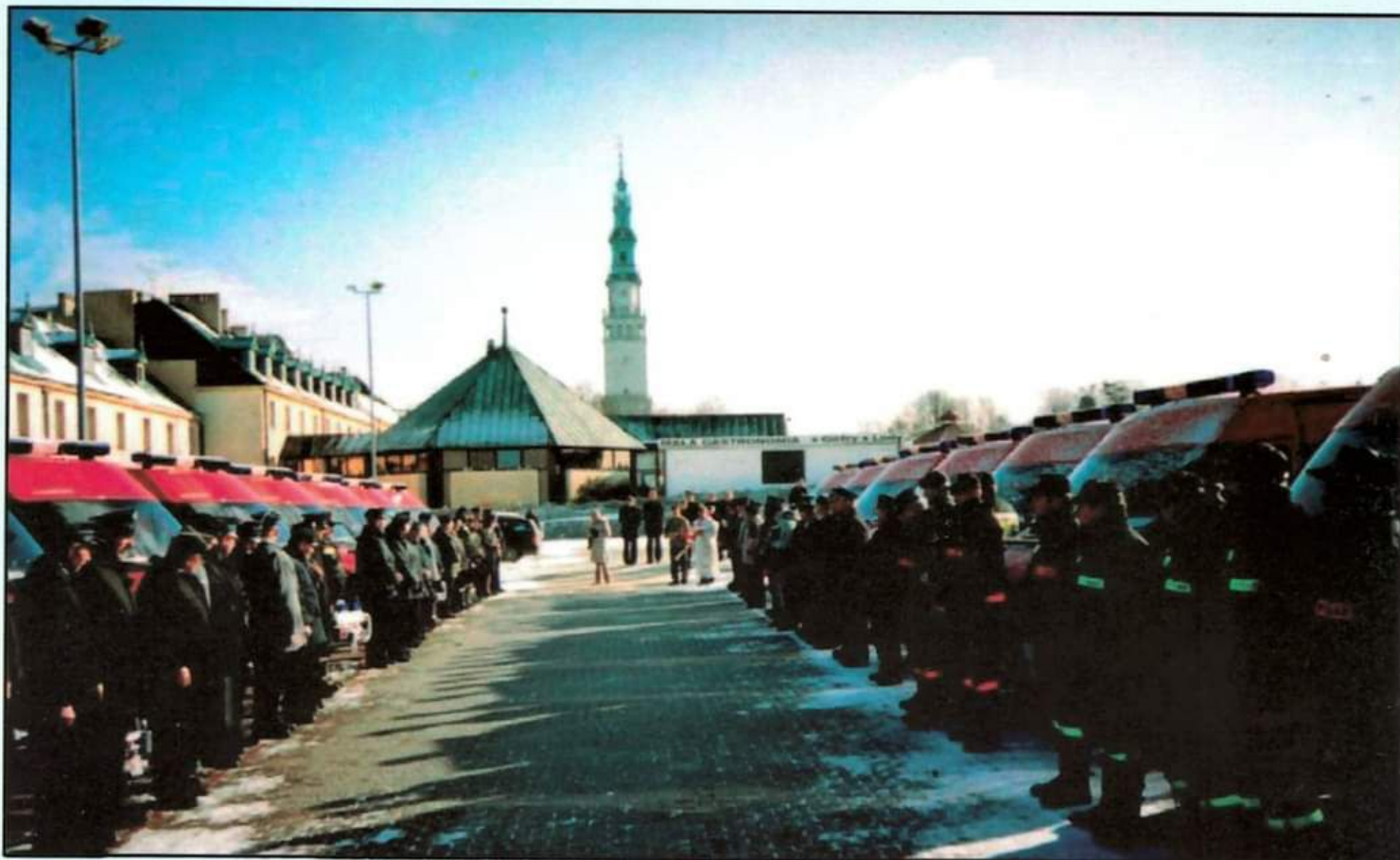
Przekazanie lekkiego samochodu ratowniczo-gaśniczego na Placu Jasnogórskim