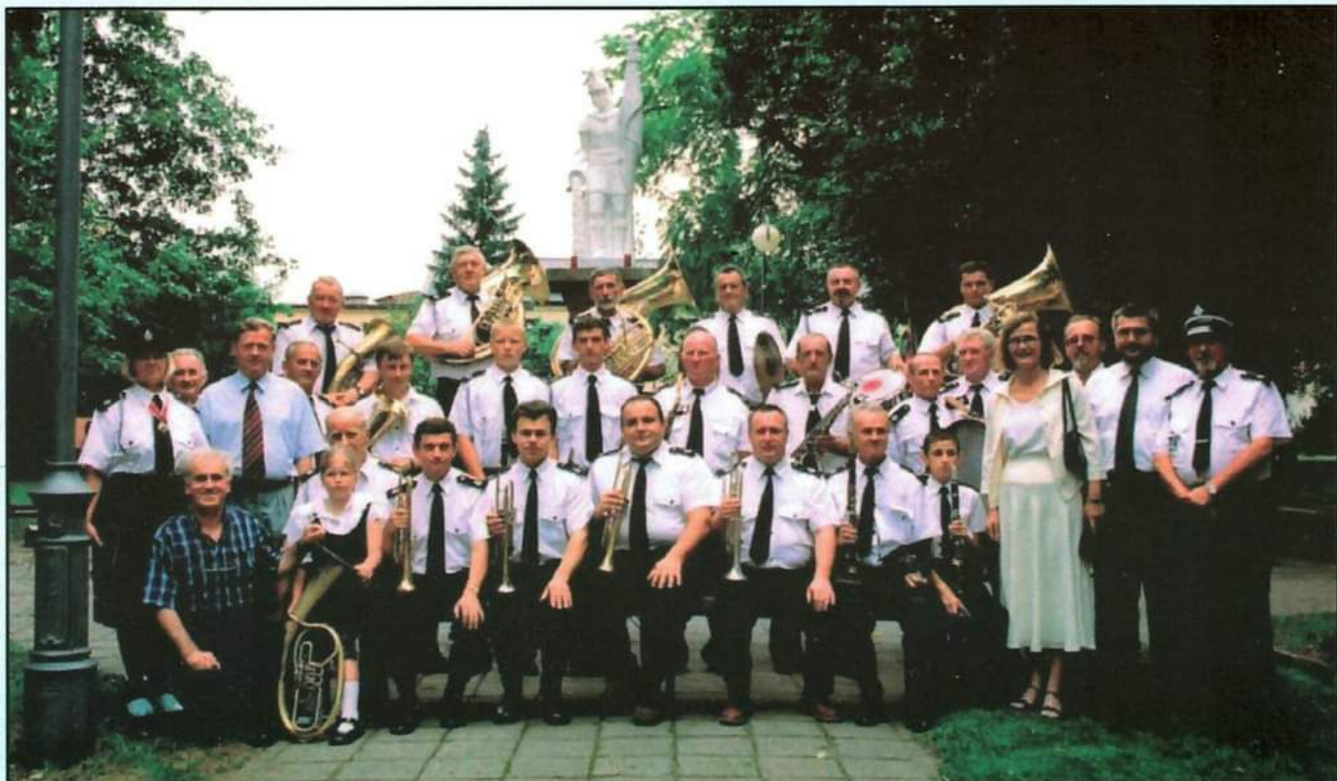
25-lecie orkiestry dętej OSP na rynku w Wieruszowie przy pomniku św. Floriana w 2002 roku.