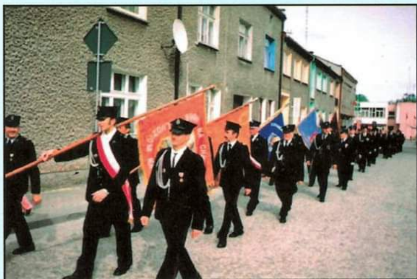
Obchody dnia strażaka w 2004 roku - przemarsz ulicami miasta Wieruszowa