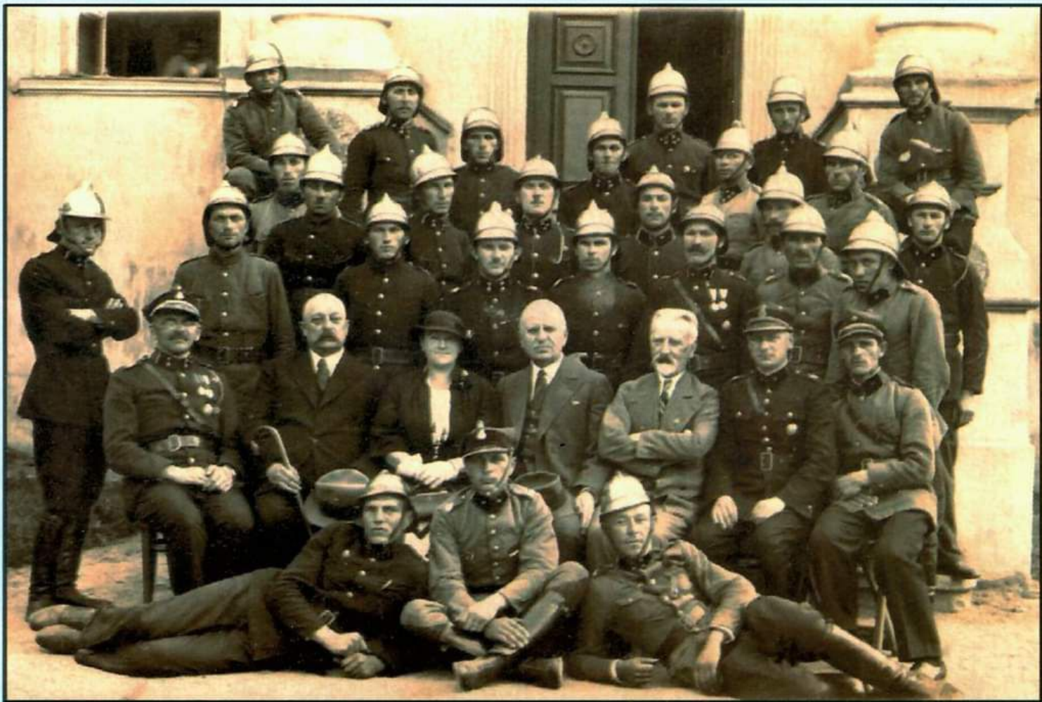
Strażacy z władzami miasta w okresie międzywojennym