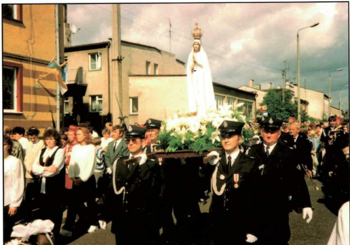
1996 - uroczysta procesja Matki Bożej Fatimskiej ulicami miasta