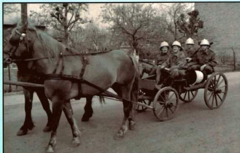
1983 - pokaz zabytkowego sprzętu strażackiego podczas obchodów dnia strażaka